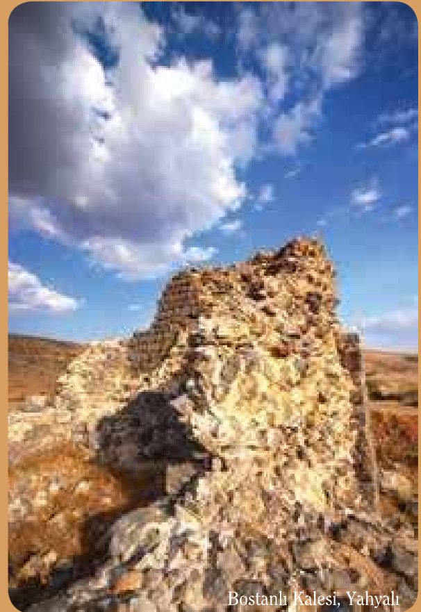
Bostanlı Kalesi, Yahyalı