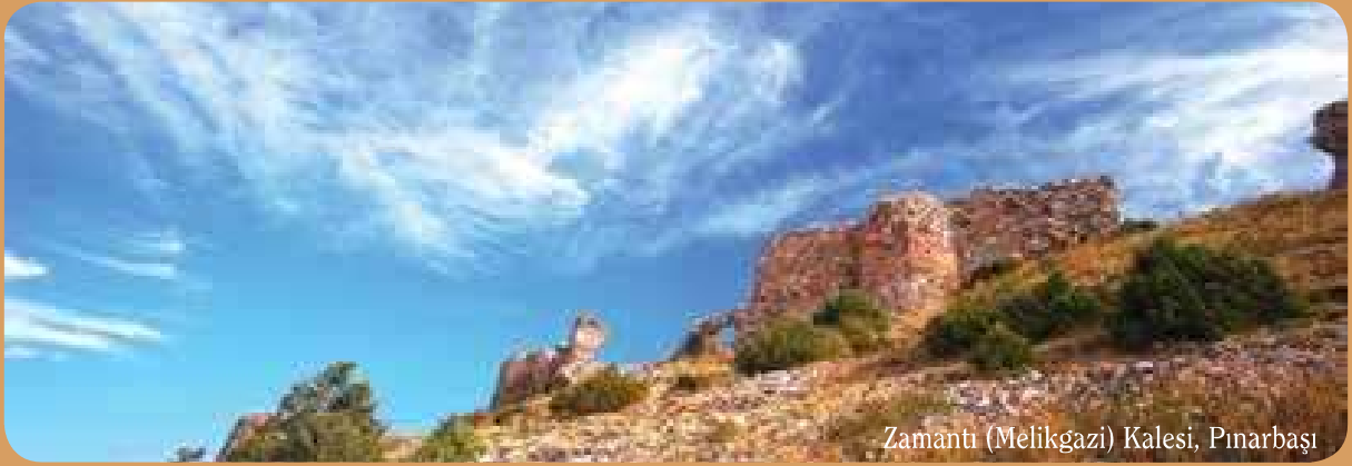
Zamanti (Melikgazi) Kalesi, Pınarbaşı