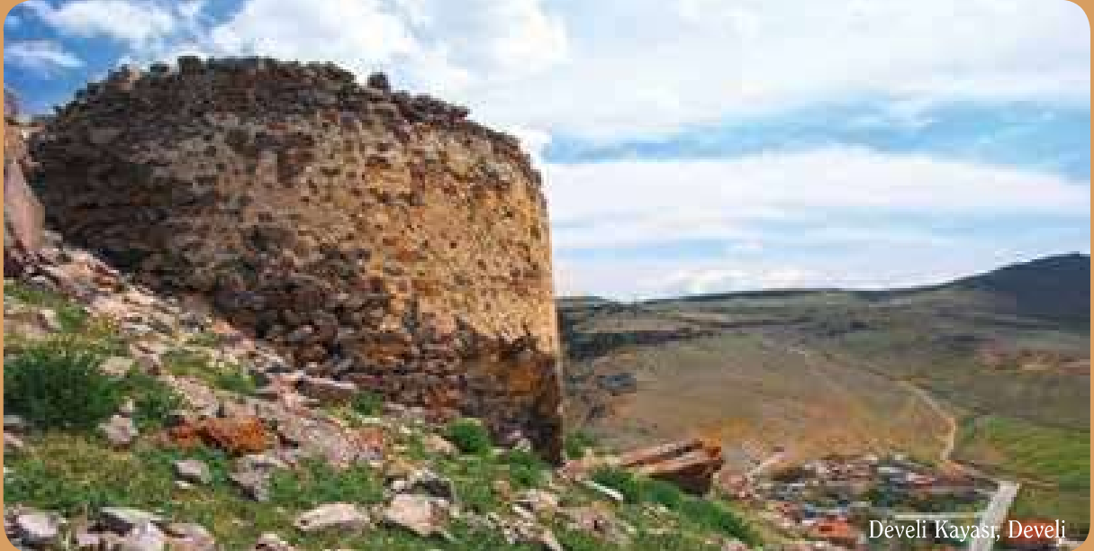
Dèveli Kayası, Develi