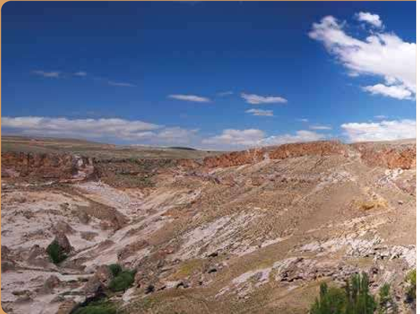
Soğanlı Vadisi, Yeşilhisar

Milyonlarca yıl önce Erciyes ve Hasan Dağı volkanlarından fıskıran lav ve küllerin soğuması sonucu ilginç yeryüzü şekillerinin meydana geldiği Kapadokya bölgesi, derin tuf vadileri, peribacaları ve insanlığa mesken olmuş kaya yerleşimleriyle biliniyor. Kapadokya'nın önemli bir parçası olan Soğanlı Vadisi, tüm bu özellikleriyle önemli bir turizm merkezi konumunda. Akköy Baraj Gölü'nden başlayarak uzanan vadi içerisinde, bir zamanlar yaklaşık iki yüz kadar kilise yer alıyordu. Bir kısmında fresklerin yer aldığı bu tarihi mekanlardan özellikle Geyikli, Tahtalı (Santa Barbara), Kubbeli, Saklı, Yılanlı, Karabaş, Tokalı ve Ballık kiliseleri ziyaret edilebiliyor.