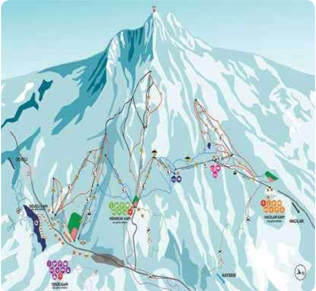
Kayak Merkezi Haritası Erciyes A.Ş. tarafından hazırlanmıştır.

Kayseri Büyükşehir Belediyesi tarafından kurulan Erciyes A.Ş.'nin geçtiğimiz yıllarda uygulamaya koyduğu Erciyes Master Planı çerçevesinde, kayak merkezi yepyeni bir çehre kazanarak gelecek yıllarda kış turizminin önemli adreslerinden biri olacaktır. Projenin bitmesiyle birlikte yeni bir kimlik kazanacak olan bölge, büyük organizasyonlara ev sahipliği yapabilecek yeterliliğe ulaşacaktır.