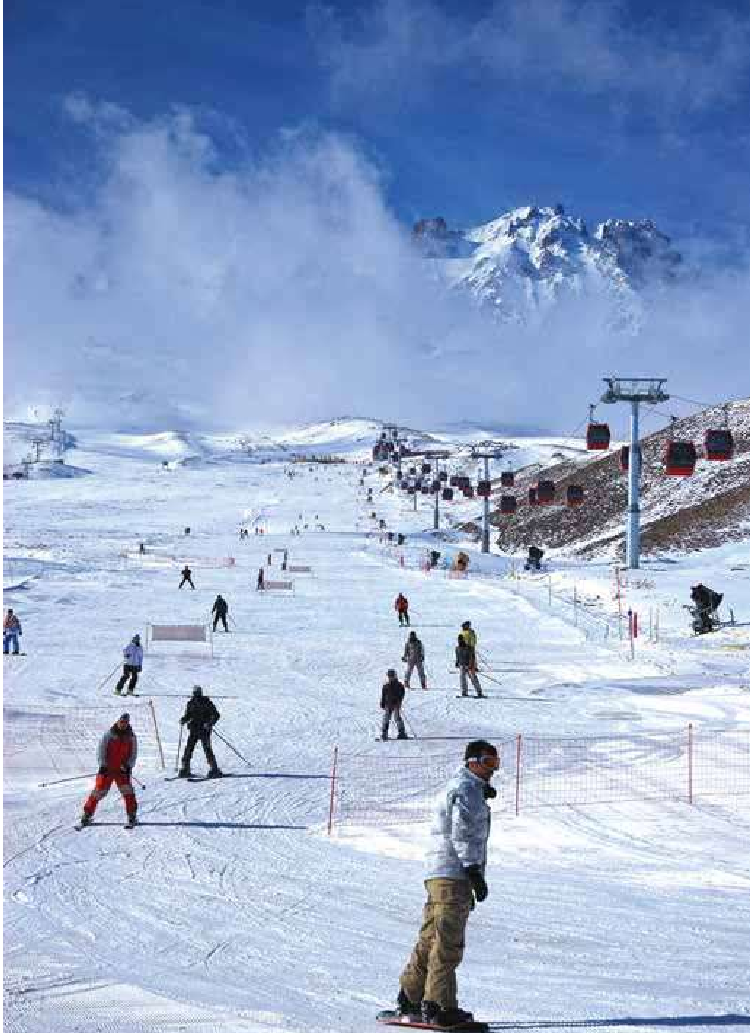
Erciyes Kayak Merkezi