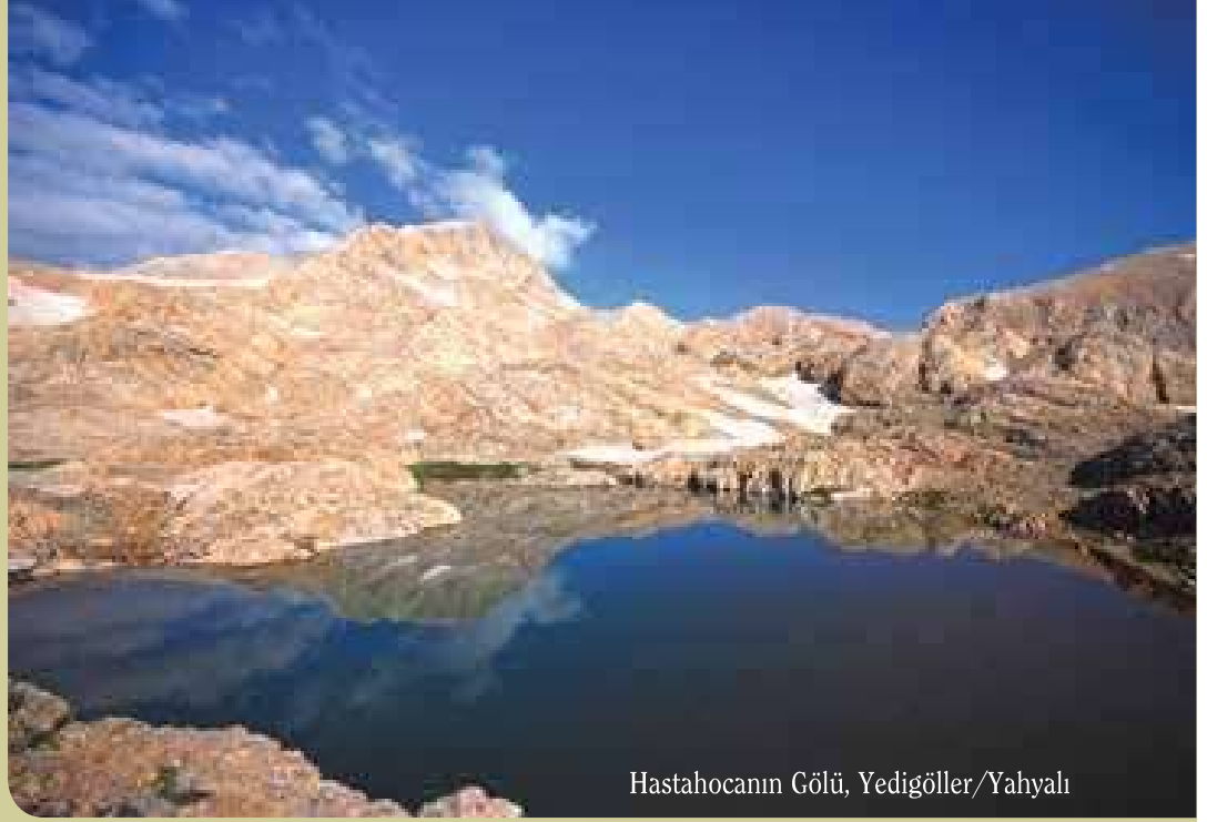
Hastahocanın Gölü, Yedigöller/Yahyalı