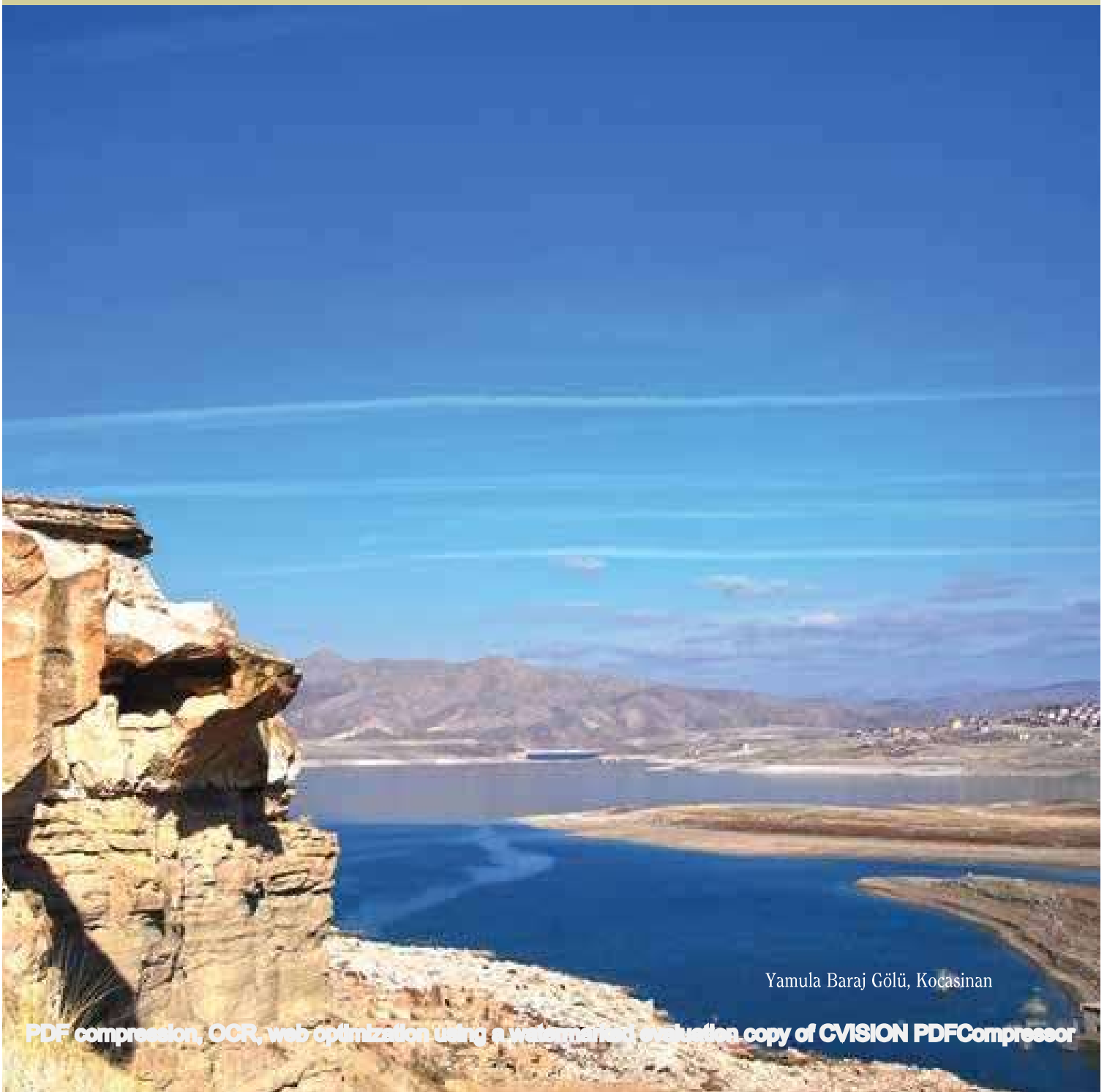
Yamula Baraj Gölü, Kocasinan