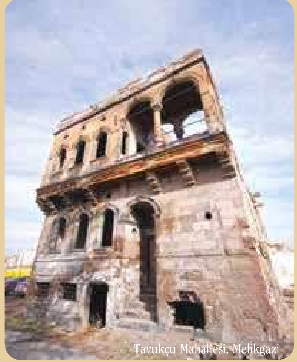
Tavukçu Mahallesi, Melikgazi