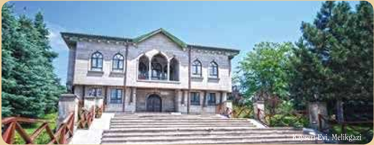
Kayseri Evi, Melikgazi