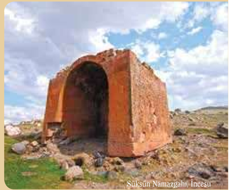
Süksün Namazgahı, İncesu