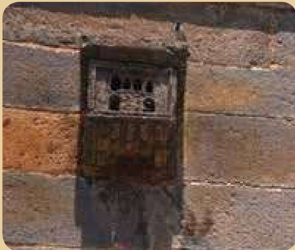
Nişancı Mehmet Paşa Camisi'ndeki Güvercinlik, Erkilet/Kocasinan