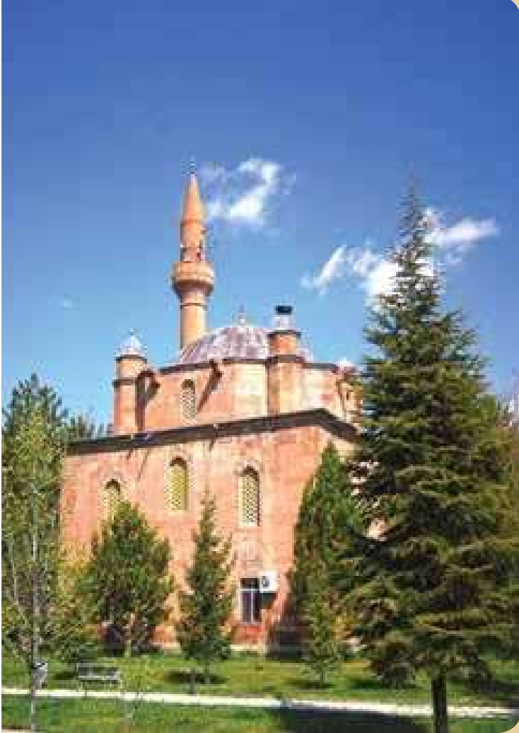
Kara Mustafa Paşa Cami, İncesu

Selçuklu ve Osmanlı dönemindeki cami ve türbe gibi İslami eserleri kapsayan tur önerimizin ayrıntıları şöyle;