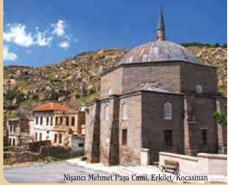
Nişancı Mehmet Paşa Cami, Erkilet/Kocasinan

Rotadaki tarihi mekanlarla ilgili ayrıntılı bilgiyi Kayseri Büyükşehir Belediyesi'nin ve İl Kültür Müdürlüğü'nün internet sitelerinden temin edebilirsiniz.