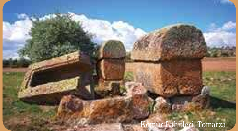
Kömür Lahitleri, Tomarza