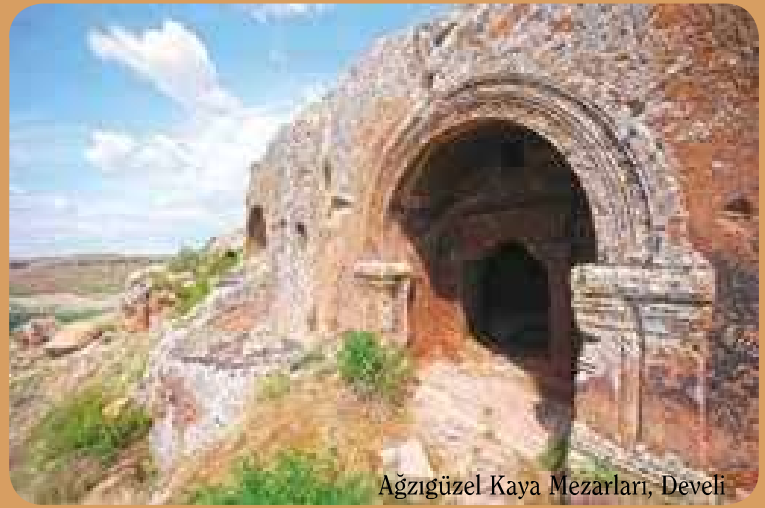
Ağzıgüzel Kaya Mezarları, Develi