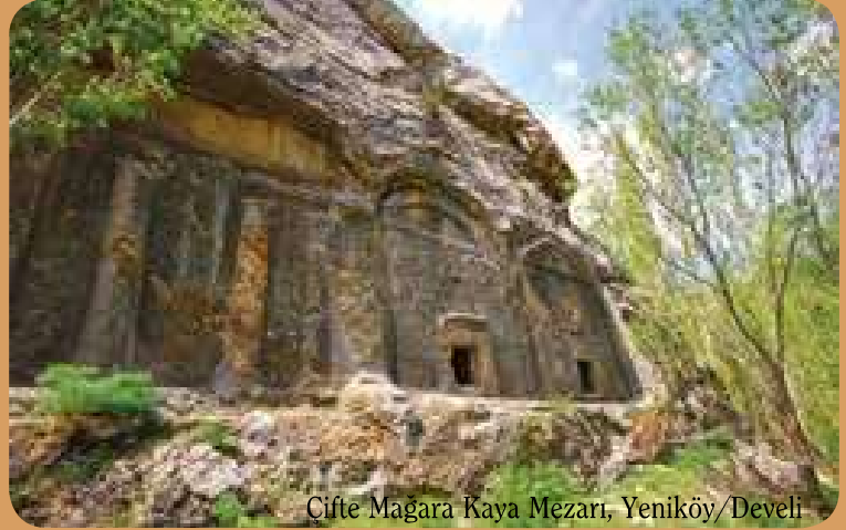
Çifte Mağara Kaya Mezarı, Yeniköy/Develi