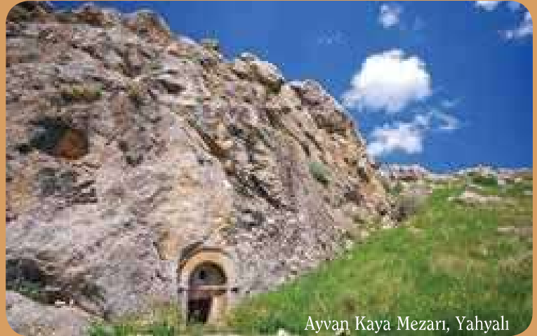
Ayvaz Kaya Mezarı, Yahyalı