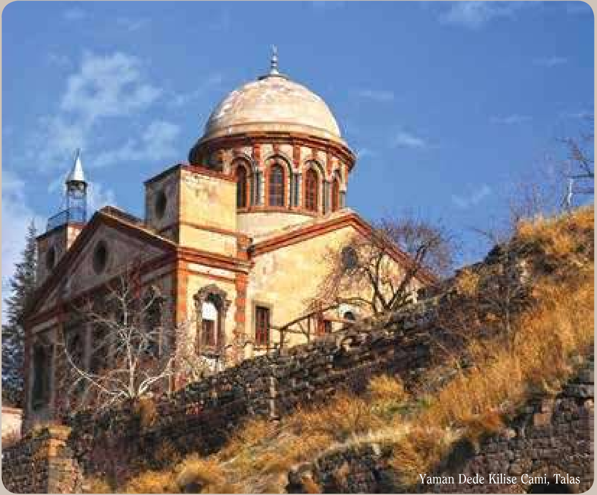
Yaman Dede Kilise Cami, Talas