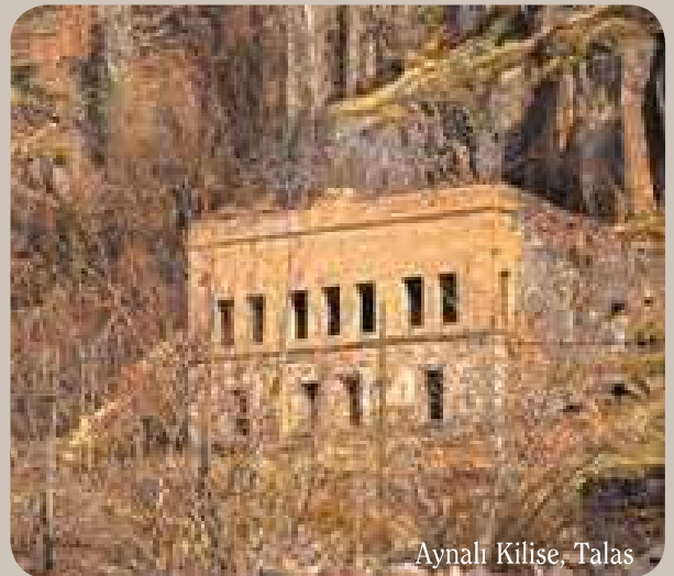
Aynalı Kilise, Talas