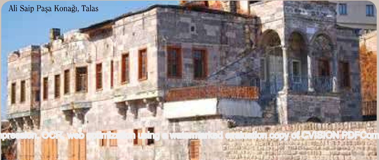
Ali Saip Paşa Konağı, Talas

Tarihi cadde Gölbaşı Meydanı'na açılmaktadır. Bu noktada Ali Saip Paşa, Aksoylar ve Samur Konakları başta olmak üzere diğer tarihi yapıları ziyaret edebilirsiniz. Şimdi karşıdaki Erhan Caddesi'ne girerek ilerleyin. Yine eski kent dokusunu yansıtan tarihi binaların eşliğinde yürüyerek Harman Meydanı'na ulaşacaksınız. İlçe Halk Kütüphanesi olarak hizmet veren Rüştiye