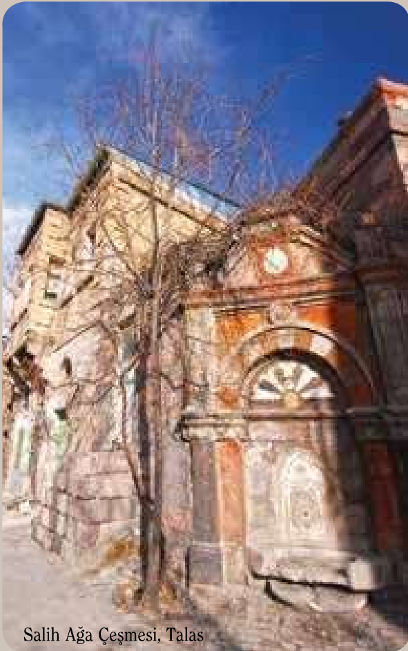
Salih Ağa Çeşmesi, Talas