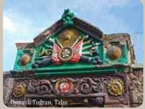
Osmanlı Tuğrası, Talas

Talas turumuz Ali Saip Paşa Caddesi'nin kuzey ucundan başlıyor. İlk tarihi mekân, 19. yüzyıla tarihlenen ve Jandarma Konağı olarak anılan bina. Hemen yanındaki Kıçıköy Aşağı Camii 'ni ziyaret