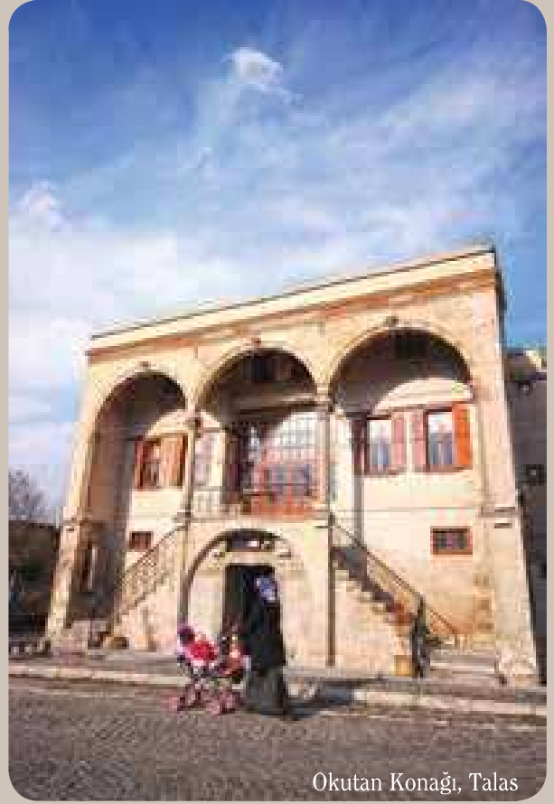
Okutan Konağı, Talas

Karaman Bayırı'nda yükseldikçe, yerleşimin Aşağı Talas bölümü tüm ayrıntısıyla görüş alanınıza girecektir. Yokuşun sonunda vardığınız Yukarı Mahalle'nin ilk tarihi mekânı Kuyumcular Çarşısı'dır. Sonra Düzyol Sokak üzerinden ana yola çıkın. Hemen karşınızda Eski Amerikan Hastanesi ve Amerikan Koleji lojmanlarına rastlayacaksınız. Bu noktada tekrar sola dönerek Kayabaşı Sokak'a girin. Tüm Talas yerleşimini yüksek bir seyir terasından izleyen Alaybey ve Feyzioğlu Konakları ile Devir Köşkü, Yukarı Mahalle'nin en özel mekânları arasında.