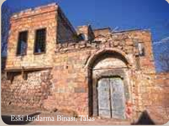
Eski Jandarma Binası, Talas

Hem bağ ve bahçeleriyle ünlü bir sayfiye yeri, hem de yüzyıllar boyunca farklı medeniyetlere ev sahipliği yapan tarihi bir yerleşke olan Talas, şehir merkezine sadece 7 kilometre uzaklıkta bulunuyor. İlçe sınırlarında yer alan bir dizi ayrıntıyı kaçırmamak için, mutlaka 5 kilometrelik 'Talas Kent Turu' güzergâhını keşfe çıkmalısınız.