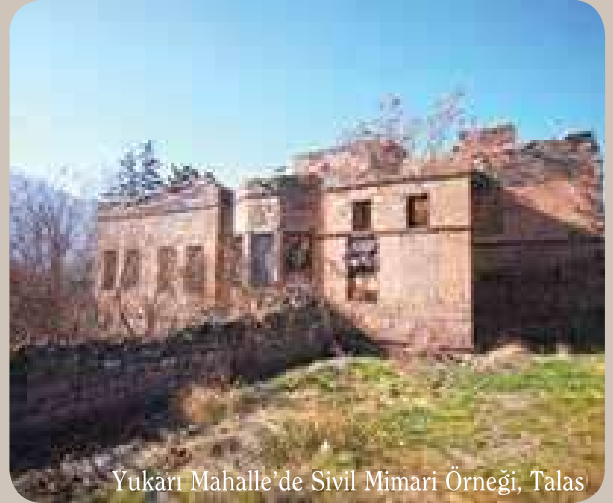
Yukarı Mahalle'de Sivil Mimari Örneği, Talas