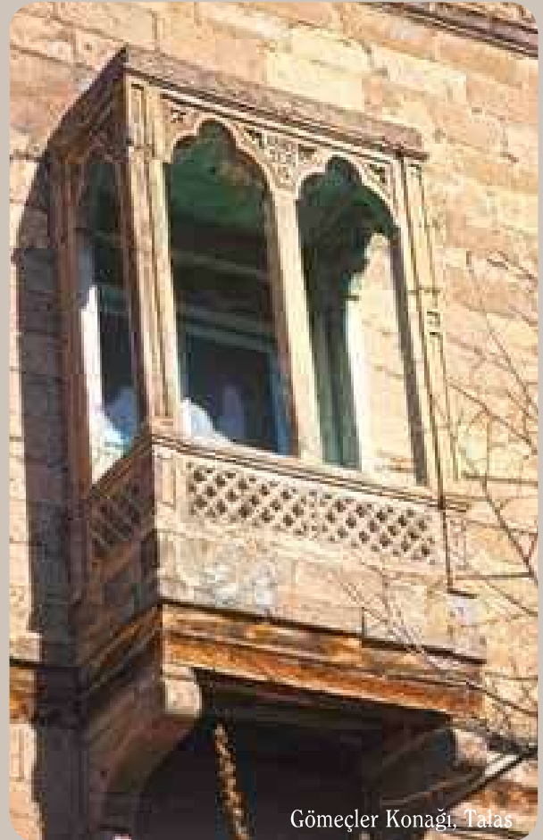
Gömeçler Konağı, Talas